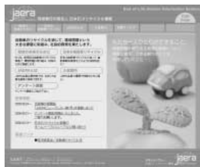
ELV機構ホームページ