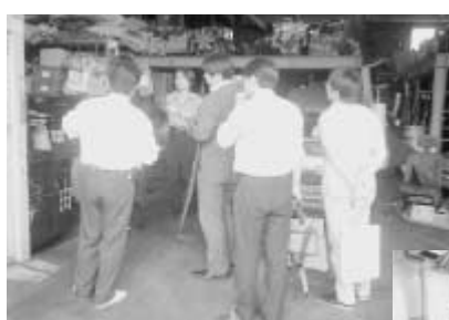
▲廃ガソリンの扱いについて 経済産業省担当が視察

JAERA告知板は、ELV機構会員限定の情報提供サービスです。閲覧するためには、IDとパスワードが必要で、IDは「member」、パスワードは「elv」。それぞれ全会員共通です。IDとパスワードを変更する場合は、日本ELVニュースなどでお知らせしていきます。