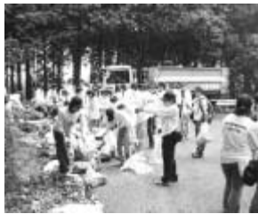
清掃活動の参加者は千人を超えた

「24時間テレビ富士山をきれいにするプロジェクト」は今年で3回目の取り組み。この間に延べ3117人のボランティアが参加し、68トものゴミを撤去した。第3回目のプロジェクトの様子は、