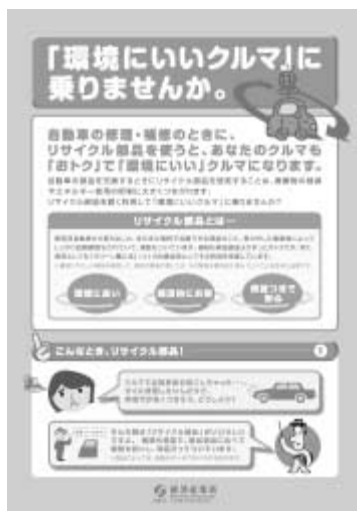
▶経済産業省が作成したパンフレット

ため「リサイクル部品普及キャンペーン」を実施する。10月2日(日)を全国統一キャンペーンの日とし、地域組合・部品販売団体などが全国各地でPR活動を実施するほか、自治体が開催するリサイクル関連