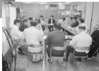
ELV会員らとの意見交換▶